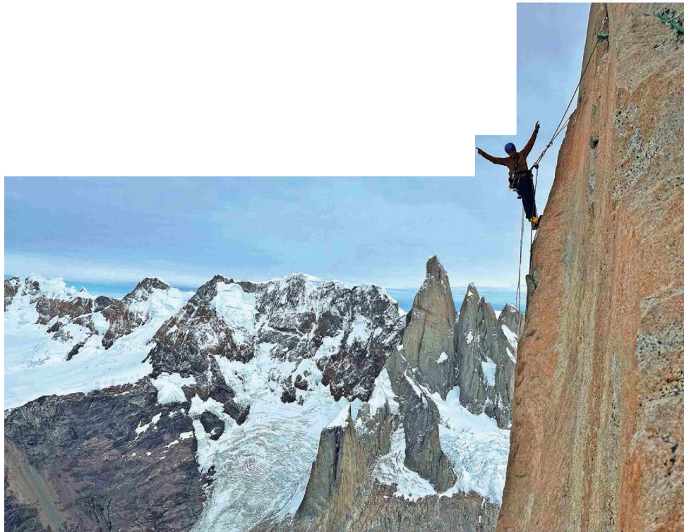
Steno sta premagovala tri dni in nanizala 30 ur efektivnega plezanja.