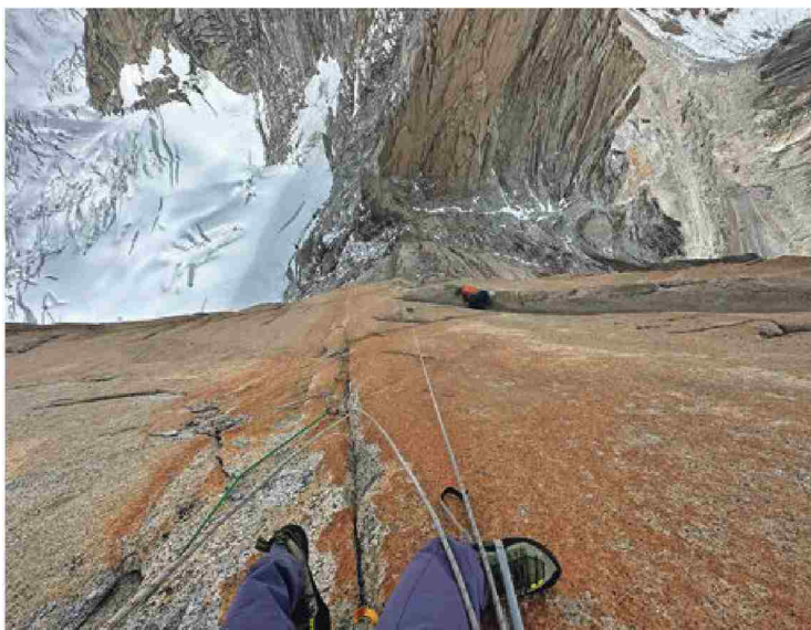
Plezalna naveza, dolga 20 let. In vse skupaj je pot, osebna in športna.